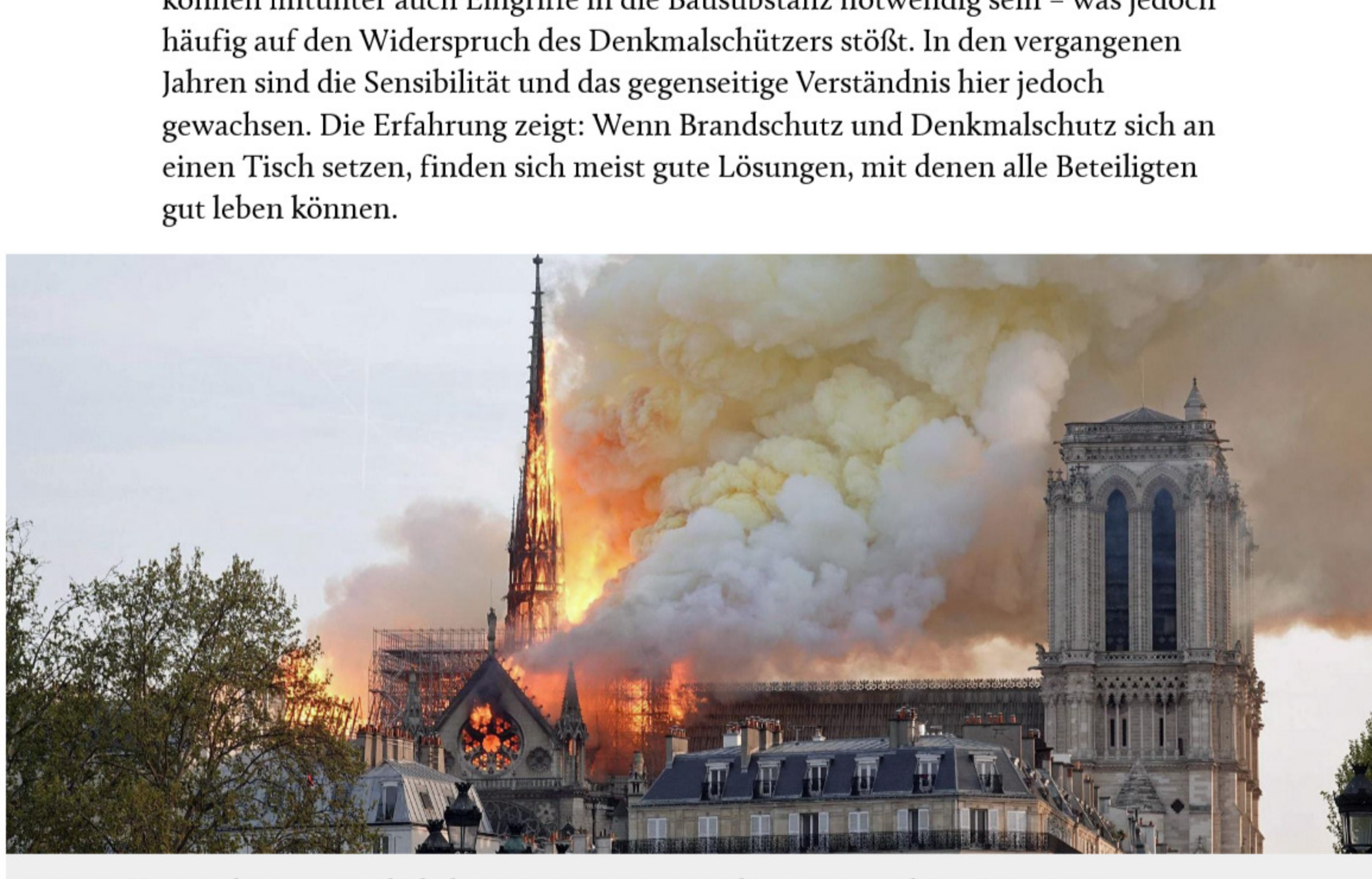
Das Großfeuer in der Pariser Kathedrale Notre-Dame am 15. April 2019 sorgte weltweit für Entsetzen.

Kabat: Das kann in der Tat ein Problem sein, weil hier zwei Fachbereiche mit völlig unterschiedlichen Aufgaben und Interessen aufeinandertreffen. Dem Brandschützer geht es vor allem darum, ein Gebäude brandschutztechnisch so zu ertüchtigen, dass Menschen es im Brandfall sicher verlassen können. Dafür können mitunter auch Eingriffe in die Bausubstanz notwendig sein – was jedoch häufig auf den Widerspruch des Denkmalschützers stößt. In den vergangenen Jahren sind die Sensibilität und das gegenseitige Verständnis hier jedoch gewachsen. Die Erfahrung zeigt: Wenn Brandschutz und Denkmalschutz sich an einen Tisch setzen, finden sich meist gute Lösungen, mit denen alle Beteiligten gut leben können.